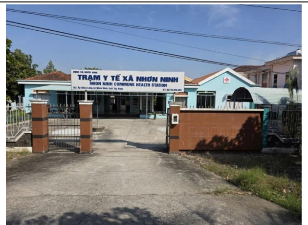
Hình: Trạm y tế xã

+ Điểm ấp Tân Long quy mô diện tích đất xây dựng: 949 m 2 , diện tích xây dựng 187,74 m 2 , có 14 phòng bệnh và Phòng chức năng.