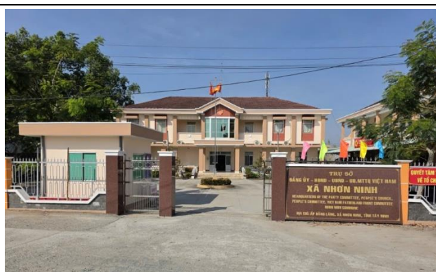
Hình: Trụ sở Đảng Ủy-HĐND-UBND-UBMTTQ xã