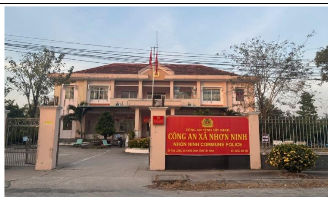
Hình: Trụ sở Công An xã