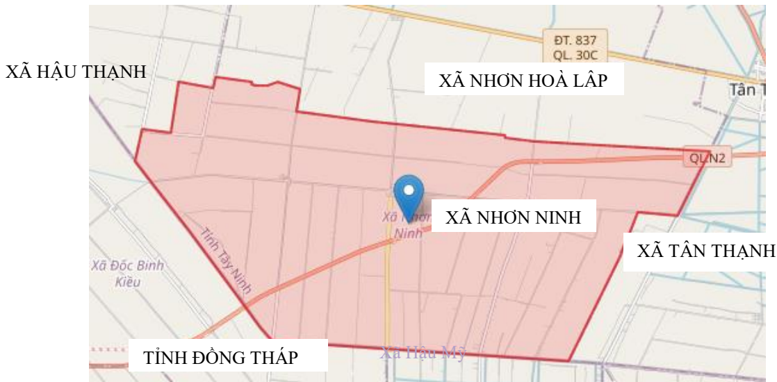
Hình: Vị trí khu vực lập quy hoạch