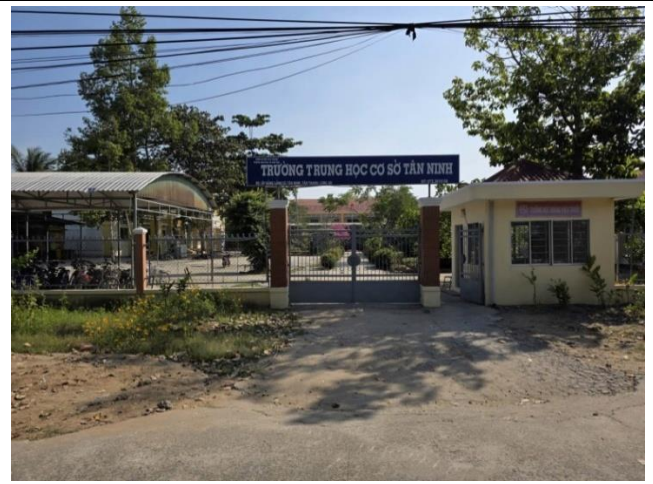
Hình: trường THCS Tân Ninh