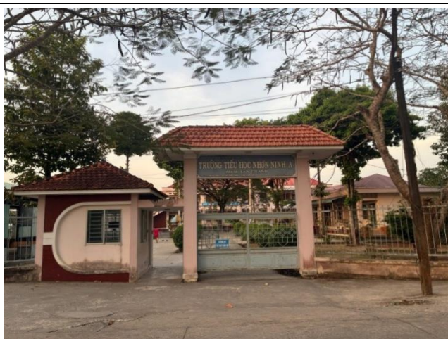
Hình: trường Tiểu học Nhơn Ninh A