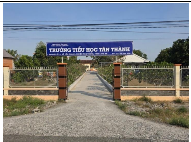
Hình: trường Tiểu học Tân Thành