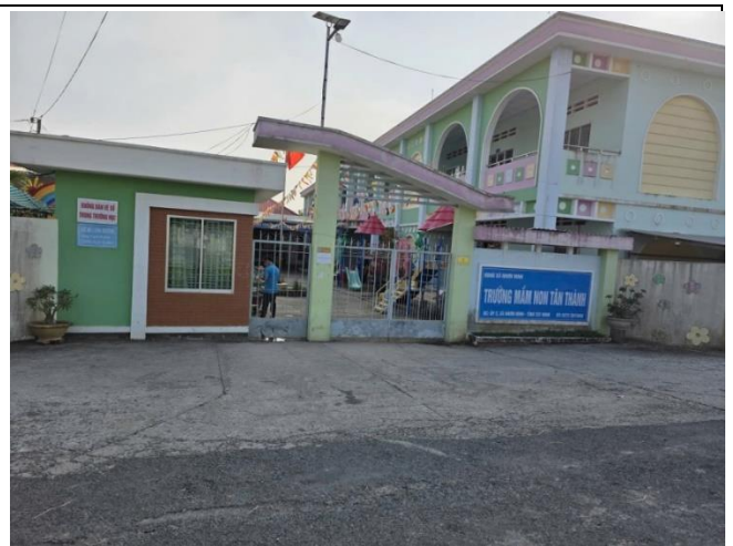
Hình: trường Mầm non Tân Thành