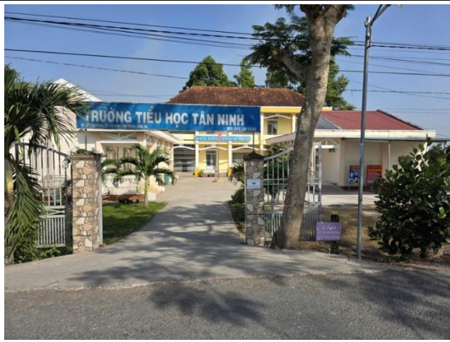
Hình: trường Tiểu học Tân Ninh