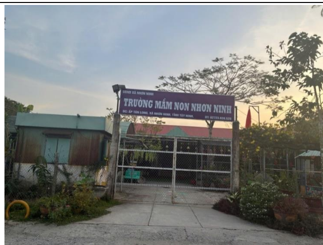
Hình: trường Mầm non Nhơn Ninh