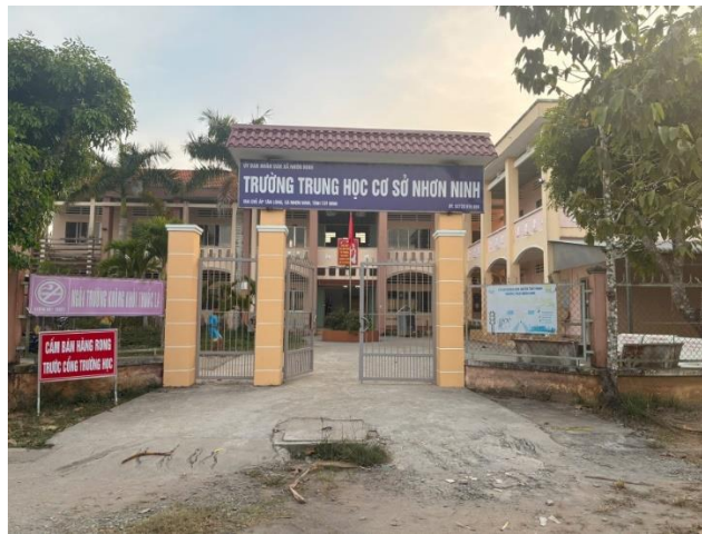
Hình: trường THCS Nhơn Ninh